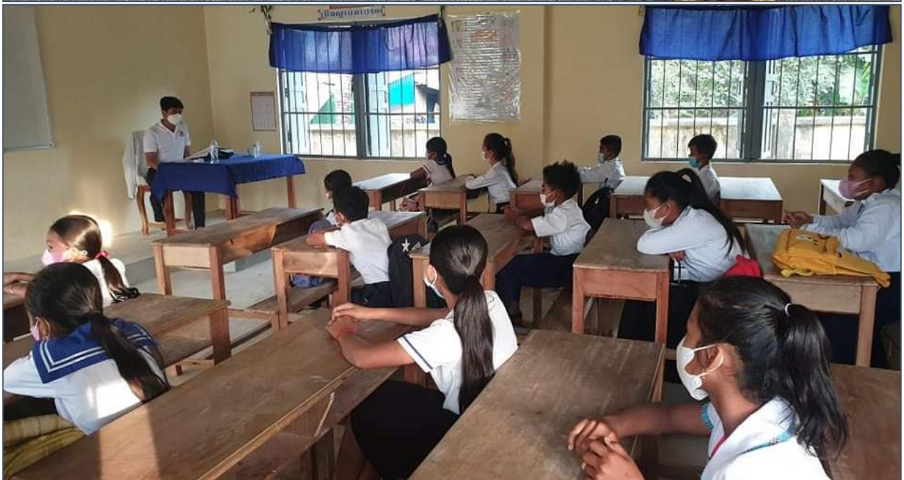
Een nieuw schoolgebouw met zes lokalen voor 250 leerlingen.