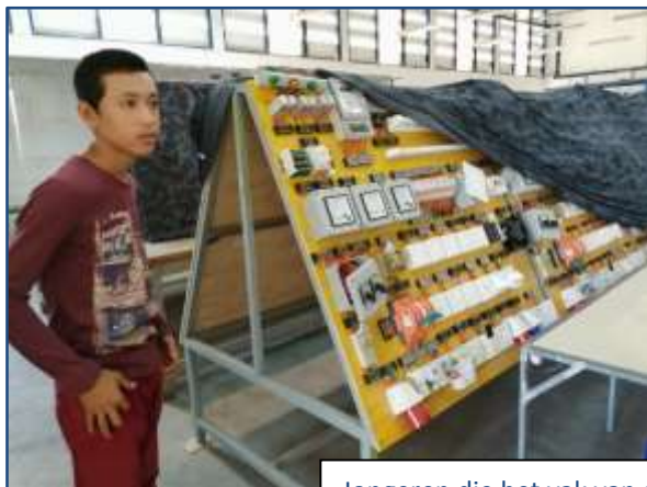
Jongeren die het vak van automonteur leren

Er zijn nog steeds veel weeskinderen in onze werkgebieden. Maar net als bij de aidspatiënten neemt het aantal ook hier af. Als ouders de aidsremmende medicijnen krijgen, wordt aids een chronische ziekte en kunnen ze voor hun kinderen blijven zorgen. Maar ook door andere oorzaken worden kinderen wees. Ouders gaan op zoek naar werk, vaak ver van huis, en de kinderen blijven achter bij grootouders of familieleden. In sommige gevallen komen de ouders niet meer terug door allerlei oorzaken. Spien wil voor deze kinderen zorgen door een pleeggezin voor hen te zoeken en de pleegouders te ondersteunen met rijst. De kinderen krijgen ook rijst, schriften, pennen en schooluniformen zodat ze naar school kunnen gaan. Kinderen in het voortgezet onderwijs die meer dan drie km van school wonen, krijgen een tweedehands fiets. De hulp van Spien stopt als het kind de leeftijd van 18 jaar bereikt, of