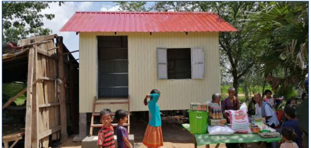
Eerste "Frits house" van 12 M 2

In 2020 verwachten we nog meer arme gezinnen te moeten helpen. Er zijn nog heel veel mensen die in armoedige omstandigheden leven, om allerlei redenen. Er zullen 105 huizen worden gebouwd voor de allerarmsten. We zullen doorgaan met het geven van voorlichting voor de aanleg en onderhoud van groentetuintjes en eventueel hulp met een lening. De Spien vrijwilligers zullen hiervoor verder worden getraind.