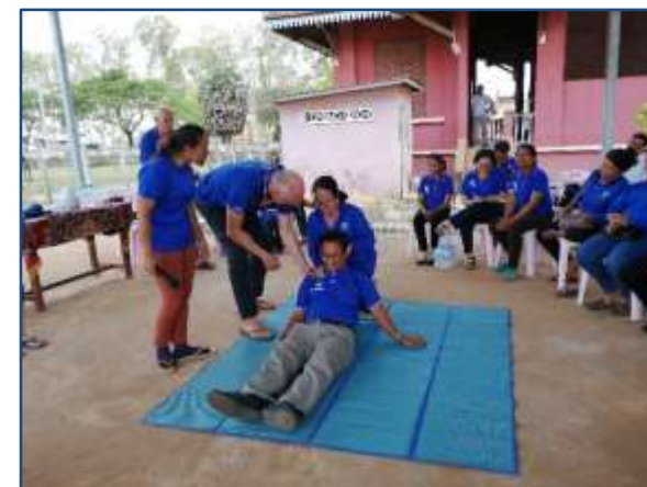
Training en voorlichting vrijwilligers