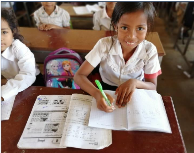
Ze vindt het leuk op school!