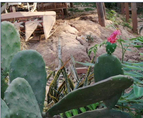
De cactus bloeit!