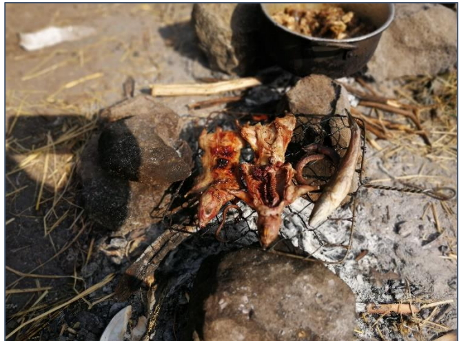
Het loopt in het rijstveld en is eetbaar. Wat is het?