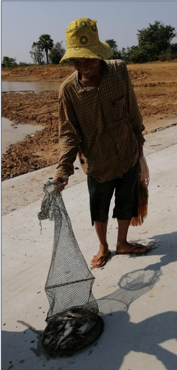
Een extra voordeel bij een irrigatieproject is dat er ook vis is. Een extra aanvulling op het dagelijks voedsel...