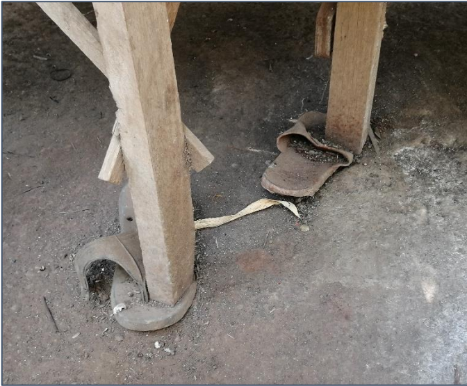
Als de tafel wiebelt...