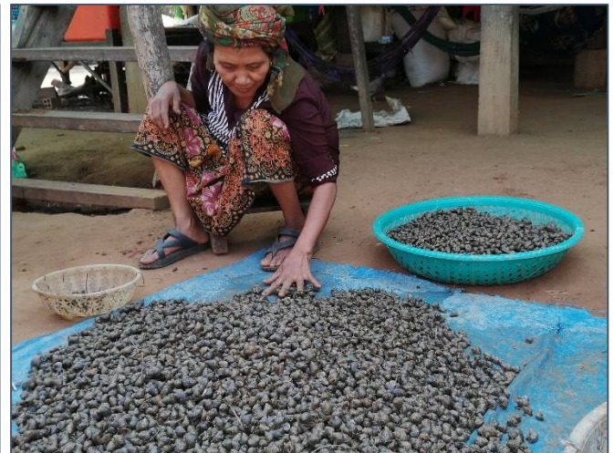
Schelpen te koop...