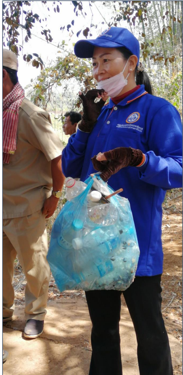
Na ontmoeting met boeren bij een irrigatieproject vertelden we over bescherming van het milieu. Dit was het resultaat...