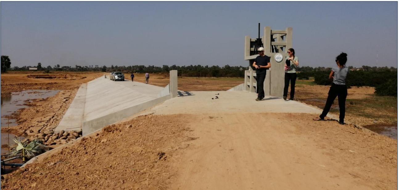
Kdak Dam, geopend in de eerste week van dit werkbezoek.