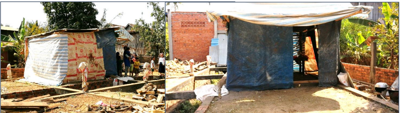
Een paar foto's van de huizen die we de afgelopen dagen hebben bezocht.