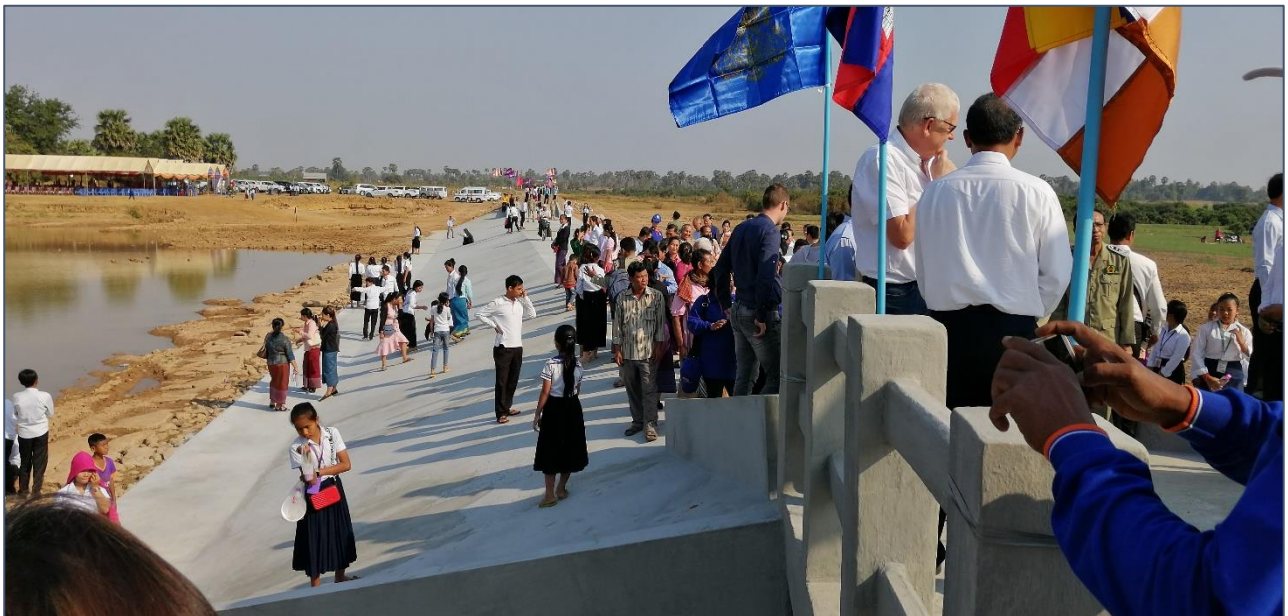
De nieuwe dam met overloop en op de voorgrond de sluis...

Dan is het tijd voor lintje knippen midden op de dijk. Als alle knipjes zijn gegeven en de minister de beslissende knip heeft uitgevoerd, is de opening een feit. De dijk is 1.100 meter lang, en er is een grote sluis in geplaatst.