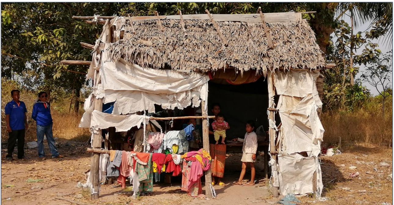
Als dit je huis is....

Helemaal achteraan woont een gezin met vier jonge kinderen, de jongste is 2 maanden. Het huisje bestaat uit een paar oude stokken en opengesneden rijstzakken, die de muren vormen. Overal gaten, ook in het dak. Dit is heel urgent en Spien zal hier volgende maand een nieuw huis voor