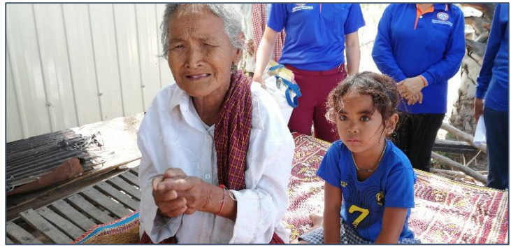
Oma (82 jaar) en haar kleindochter van 3

Oma is blij ons weer te zien! We nemen rijst, olie en andere levensmiddelen mee. Want zij kan niet meer werken op het land. We hopen dat ze nog lang leeft en voor haar kleindochter kan zorgen. Mocht dat niet zo zijn, dan zal Spien zorgen dat het meisje bij familie zal worden ondergebracht.