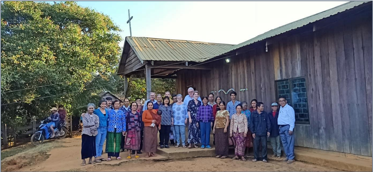
Groepsfoto voor de kerk in Dak Dam

We gaan nog een andere gemeente bezoeken in Dak Dam, waar we de gemeenteleden bemoedigen en zij op hun beurt ook ons. Ook al kunnen we elkaar niet verstaan, we delen hetzelfde geloof in Jezus, en dat verbindt over taalgrenzen heen.