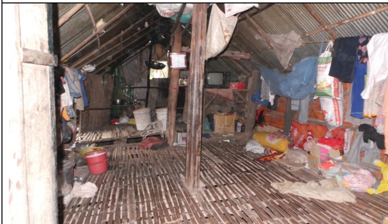
Inboedel van een huis