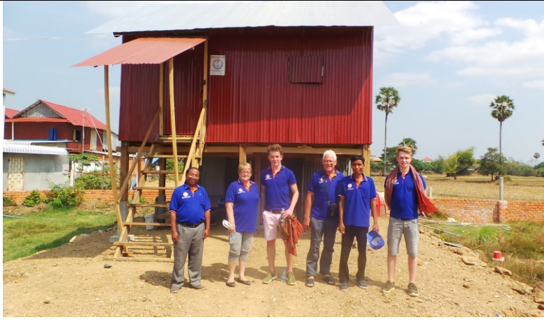
Spie-en vrijwilliger Sowat heeft een nieuw huis gekregen