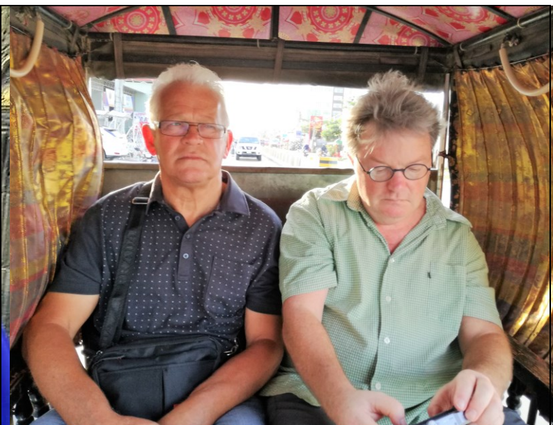
In de Tuk-Tuk