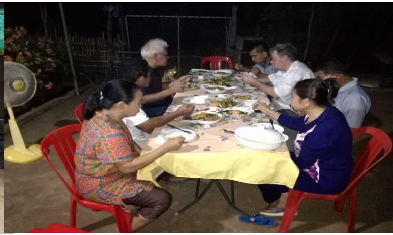
Buiten eten in januari, ook best leuk