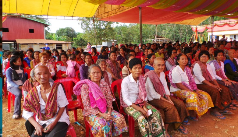
Op de voorste rij bij de school opening