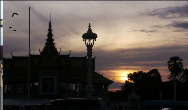
In Phnom Penh aan de rivier de Tongle Sap