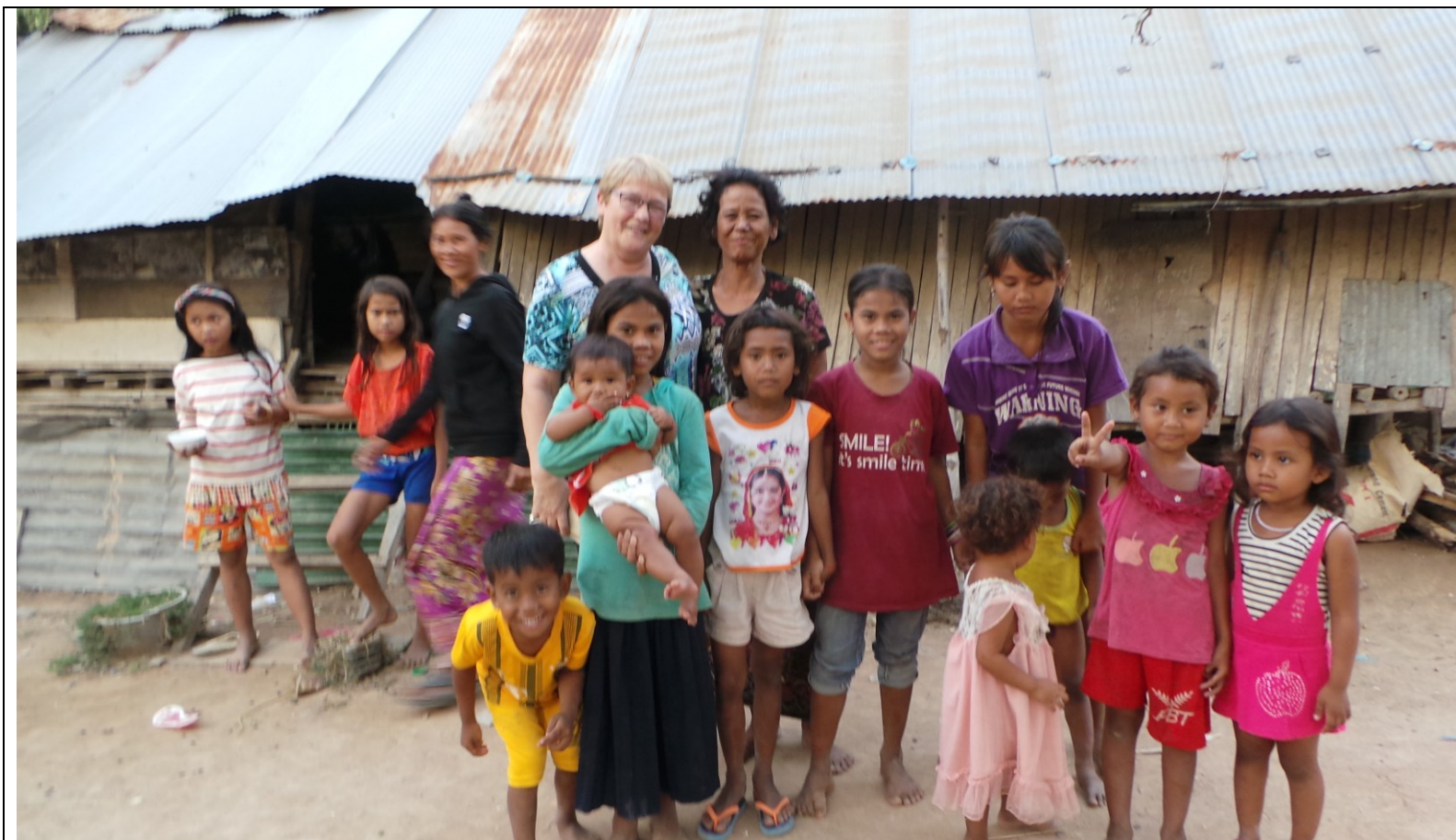
Veel kinderen die wel op de foto willen