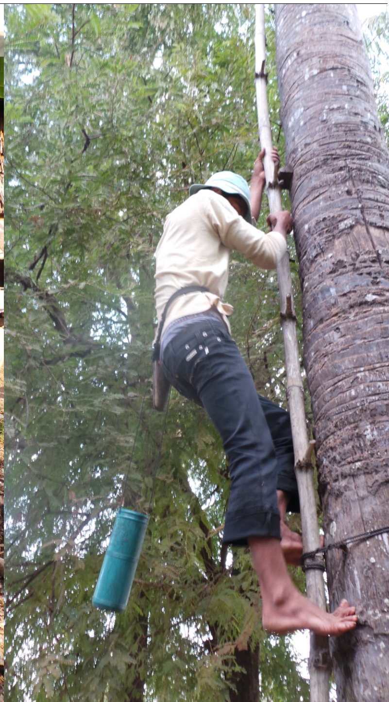
Best gevaarlijk werk