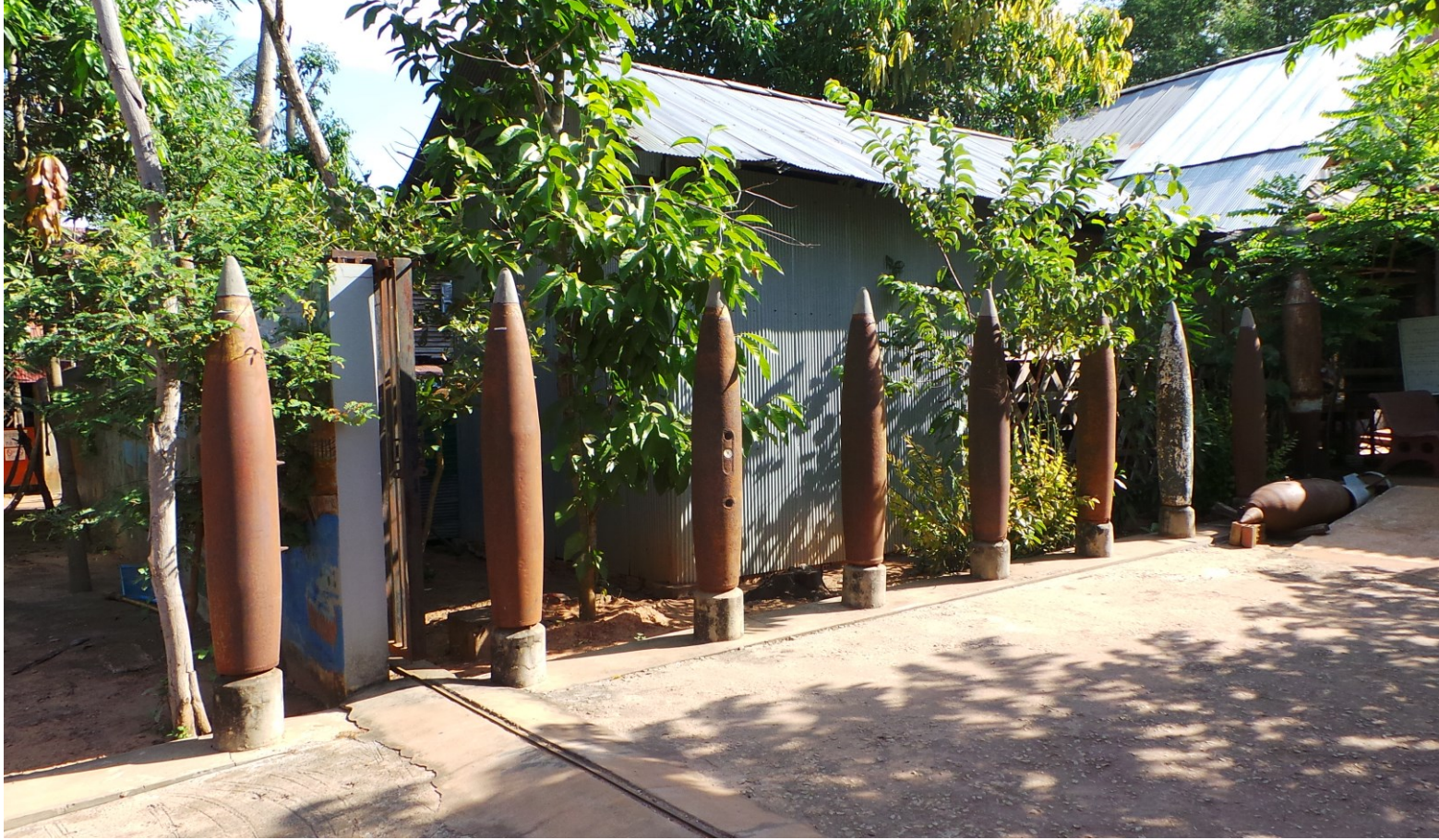
Bezoek landmijn museum (ongelovelijk veel mijnen zijn er gelegd. De gevolgen zijn zichtbaar groot door de vele gehandicapten)