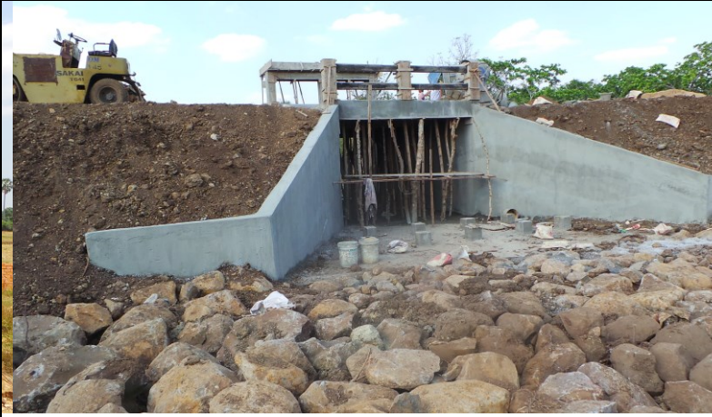
Nieuwe sluis is bijna klaar