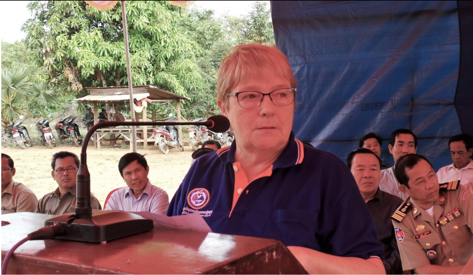
Beja tijdens haar toespraak