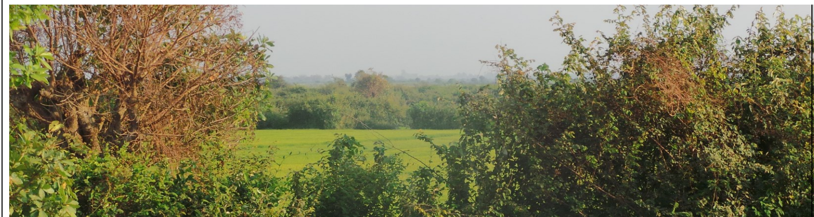
Echt bijzonder in januari. Tweede oogst omdat er water is.