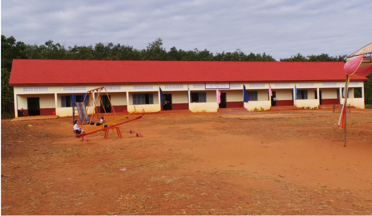
De prachtige nieuwe school met speeltoestellen