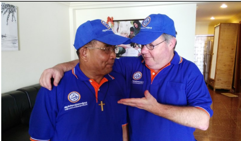
Vrienden zien elkaar terug na 25 jaar