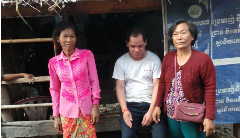
Op bezoek bij arme mensen die toe zijn aan een nieuw huis