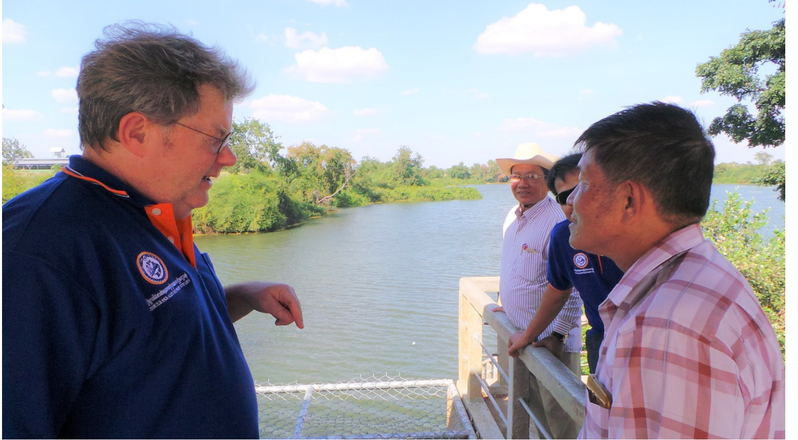
Een bijzondere ontmoeting