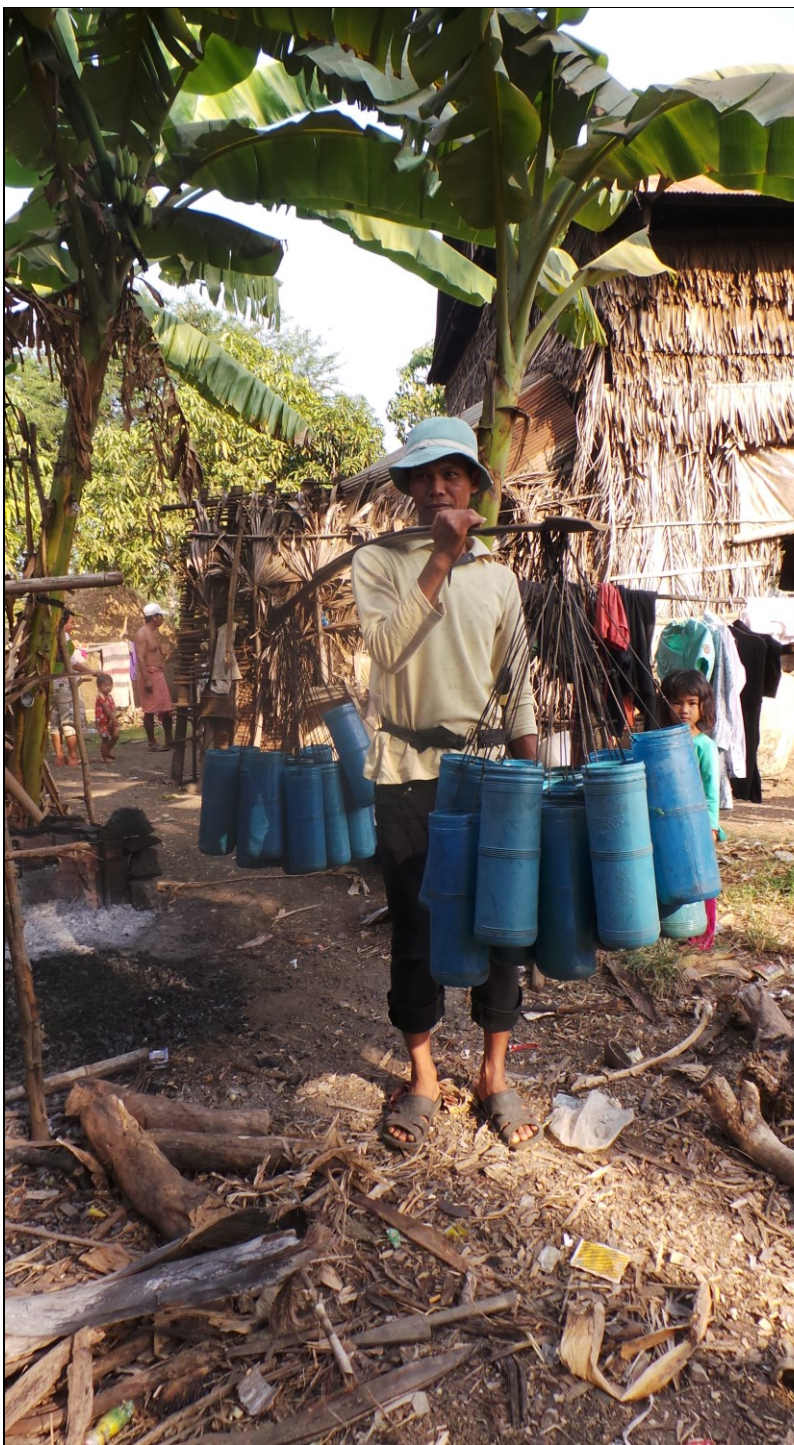
Palmsuiker uit de palmboon oogsten