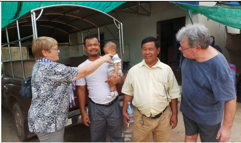
Bij Buth Njorn in Siem Reap op bezoek