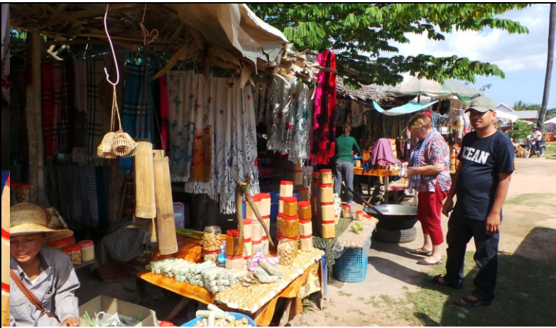
Palmsuiker van de suikerpalm gemaakt. Heerlijk!