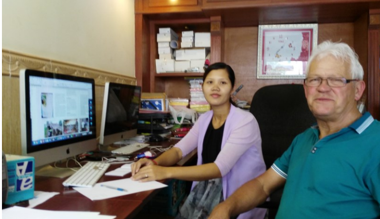
Zij gaat het Khmer boek verzorgen