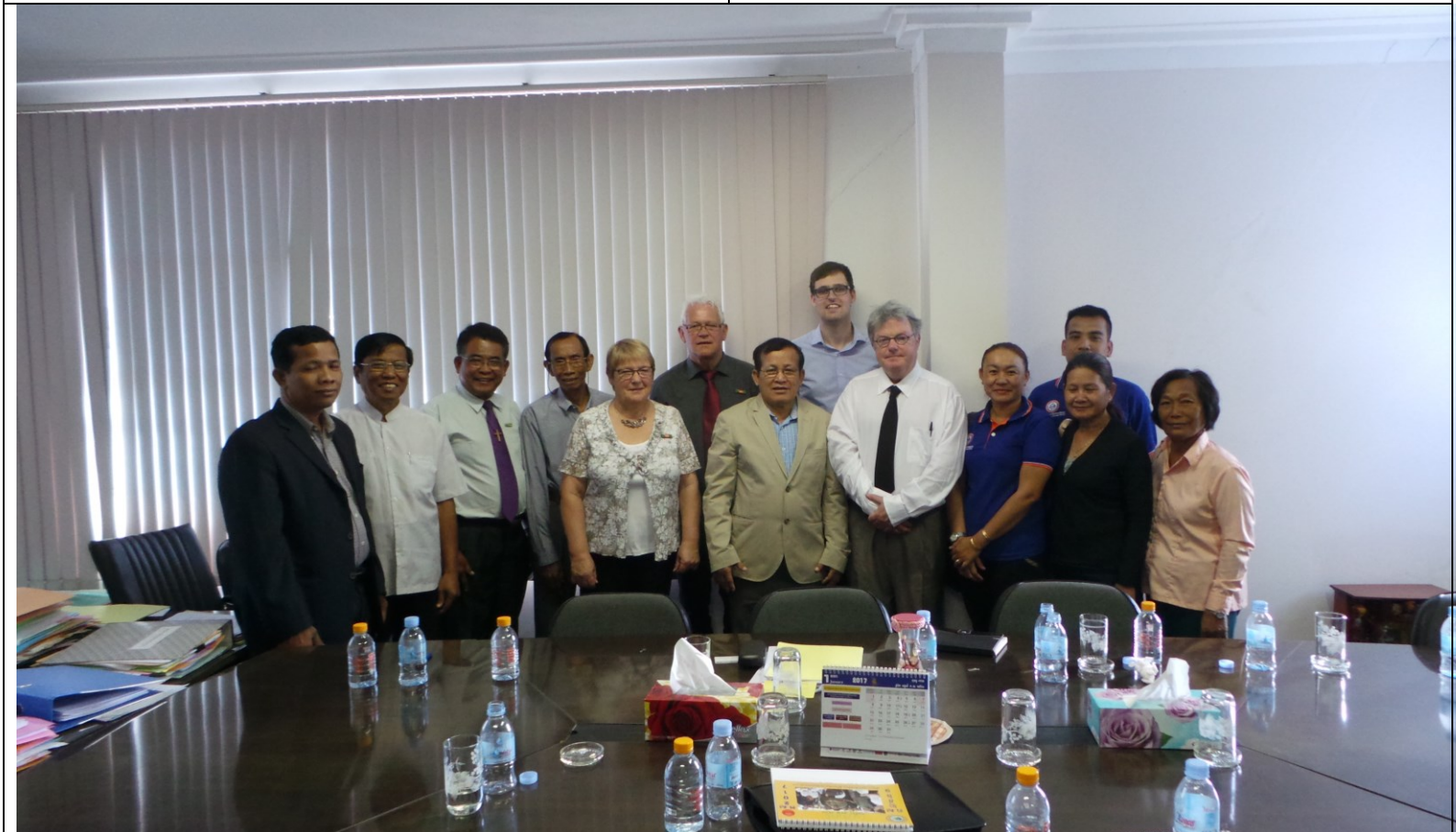
Bij de staatssecretaris van sociale-zaken op bezoek