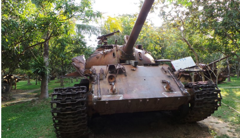
Oorlogs museum in Siem reap