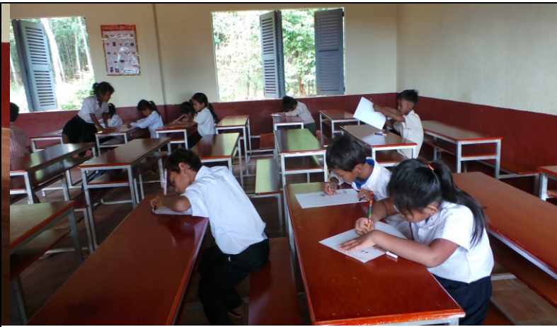
Druk voor de tekenwedstrijd