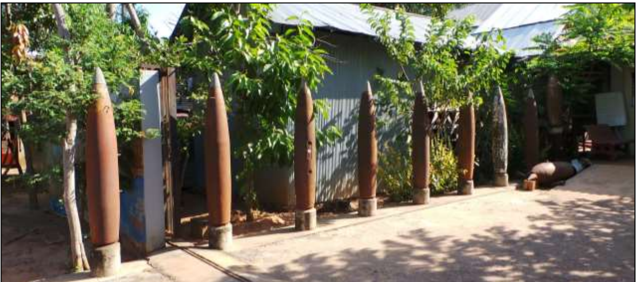
De ingang bij het Landmijnen Museum