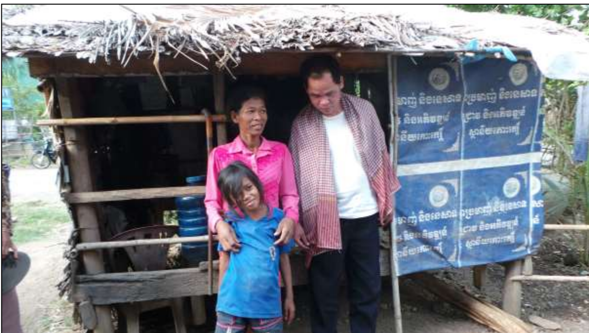
Een arm gezin voor hun armoedige huisje. De man is blind.