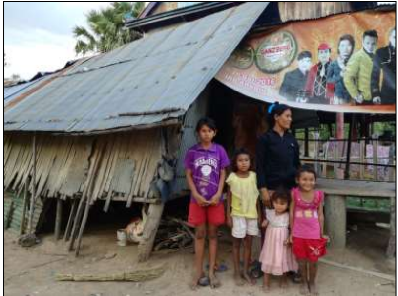
Het huis van dit gezin zakt helemaal scheef.

Ook ontmoeten we een aidspatiënte, die ons blij komt bedanken voor de hulp die Spie-en haar geeft. Haar man is overleden aan aids, ze bleef met twee kinderen achter waarvan de jongste (vier jaar) ook hiv-positief is. Maar ze straalt omdat ze er niet alleen voor staat. De vrijwilligster komt regelmatig langs om te kijken hoe het gaat en om rijst te brengen voor haar en haar kinderen. En elke twee maand gaat ze naar het ziekenhuis om nieuwe medicijnen te halen. Ze vertelt dat iedereen in het dorp weet dat ze aids heeft, en toch wordt ze niet gediscrimineerd. Een mooi voorbeeld hoe het ook goed kan gaan.