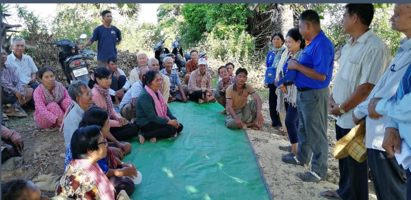
Gespannen gezichten: wordt ons project in behandeling genomen?

Ook bezoeken we nieuw aangevraagde projecten voor 2020.