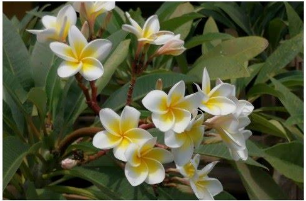
Rondom diezelfde school. Bloemen en een beeld van een wijze man.