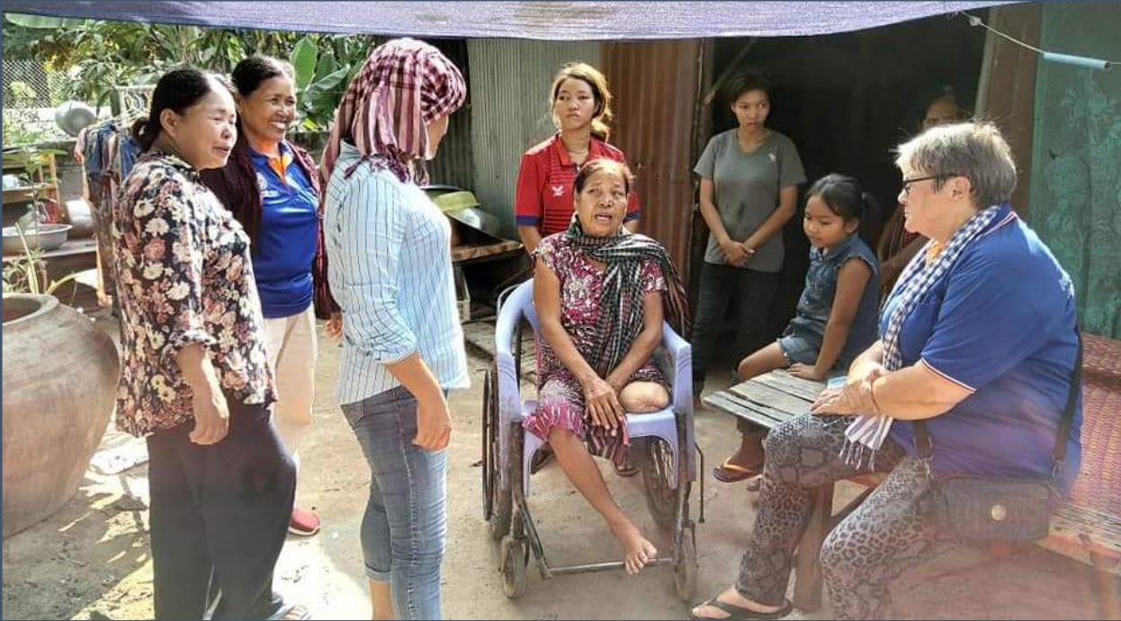
Een gehandicapte moeder, ze verloor haar been door diabetes

Nog steeds is er woningnood en behoefte aan schoon drinkwater. Er zijn veel arme mensen met name in de achteraf gebieden, die ver van de grote weg af liggen. Juist die mensen zijn onze doelgroep. De vrijwilligers weten hen te vinden en brengen de nood bij het Spien bestuur en bij ons. Na de vergaderingen nemen zij ons ook mee het veld in zodat we zelf ook kunnen zien wat nodig is.