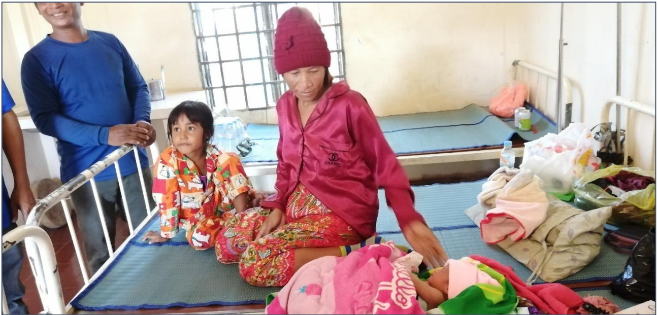
Op bezoek in een gezondheidskliniek. Er is twee dagen geleden een babytje geboren, een meisje.