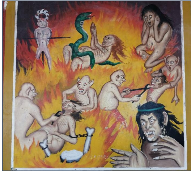
Straffen voor liegen en bedriegen

Na de lunch reizen we verder naar Stung Treng city, waar we in een guesthouse twee nachten zullen blijven.