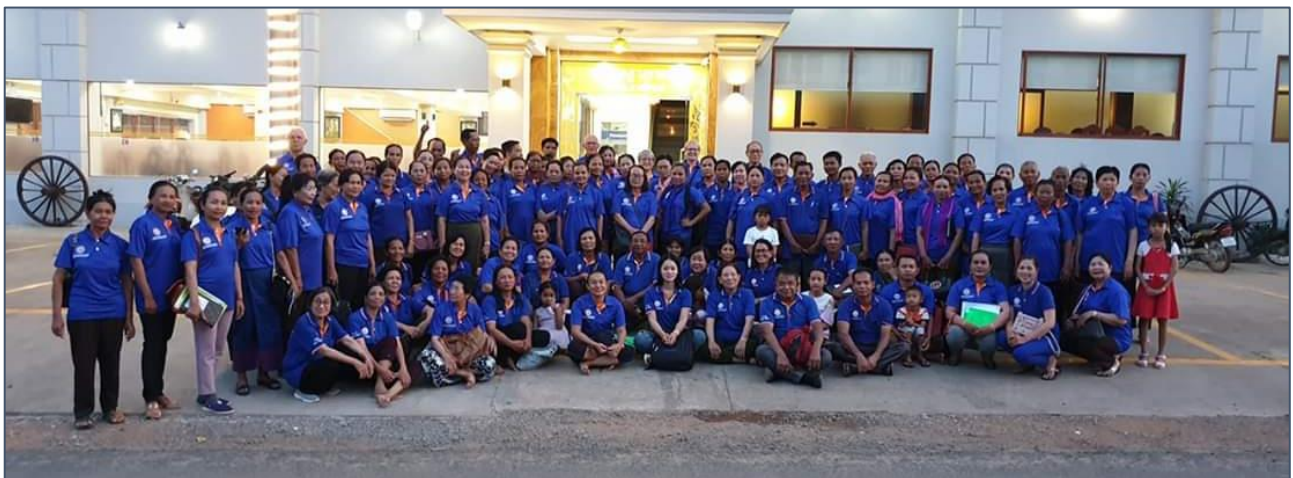
Groepsfoto voor het hotel

Aan de oever kan zelfs voorzichtig worden gezwommen, maar het is wel oppassen geblazen want er staat een sterke stroming. De meeste Cambodjanen kunnen niet zwemmen, en dus blijft het veelal bij pootje baden. En opnieuw foto's maken.