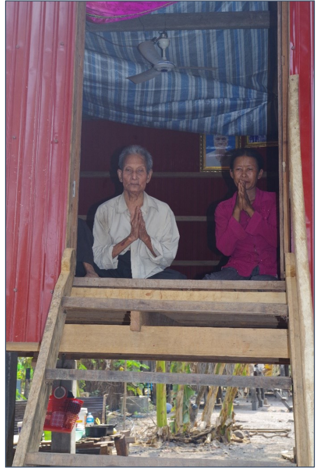
Opa met zijn dochter in hun nieuwe huis