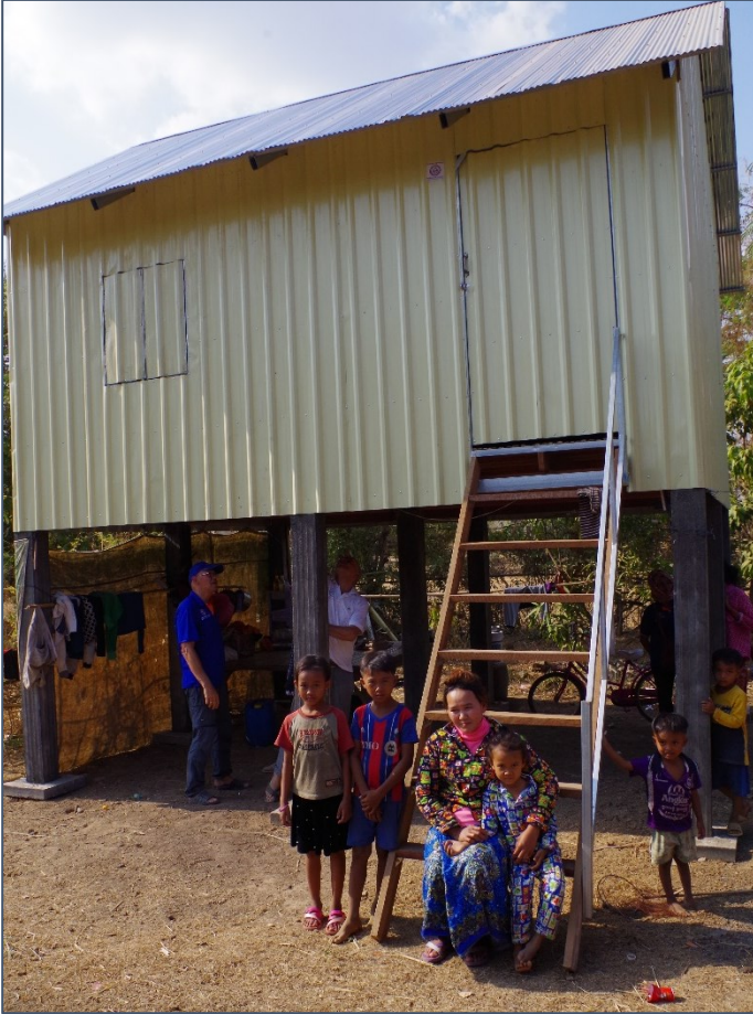
Erg blij en dankbaar!