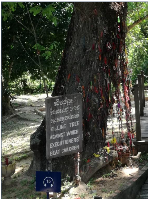
De Killing Tree

Hele gezinnen werden vermoord, zodat niemand wraak zou kunnen nemen: “Om het gras om te spitten moeten we zelfs de wortels verwijderen.”