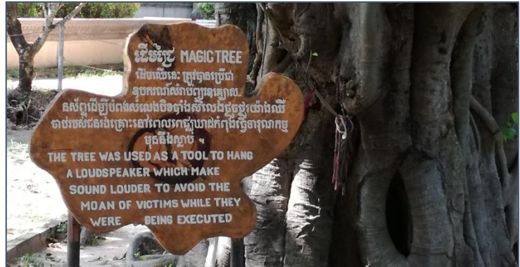
De Magic Tree

Enkele bomen in de tuin vertellen een eigen verhaal. De suikerpalm met zijn kartelachtige takken. Ze werden gebruikt om mensen de keel door te snijden, zodat ze niet langer konden gillen. De Magic Tree, waar een grote luidspreker in werd gehangen om muziek te laten horen, zodat het gegil en geschreeuw van de gevangenen niet werd gehoord door de mensen die in de buurt woonden. En dan de Killing Tree, de boom waar kinderen tegen te pletter werden gegooid onder het oog van hun moeders.