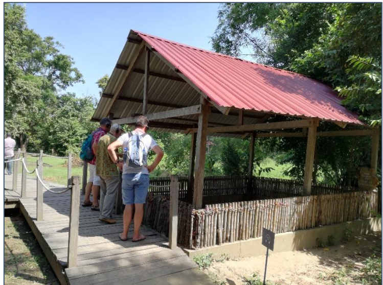
Eén van de massagraven

Pol Pot, de leider van de Rode Khmer had een grote landbouwstaat voor ogen, waarin iedereen gelijk was, behalve de leiding zelf. Op 17 april 1976 werden alle mensen de stad uitgejaagd onder het mom van mogelijke bombardementen door de Amerikanen. De leugen, dat de mensen na drie dagen terug zouden komen, werd door velen geloofd. Het werden 3 jaar, 8 maanden en 20 dagen. In die periode zijn ruim 2 miljoen mensen omgekomen door honger, zwaar werk, of ze werden vermoord omdat ze bijvoorbeeld een bril droegen of zachte handen hadden. Op gruwelijke wijze werden ze omgebracht en in de massagraven gegooid. Overal in deze tuin zie je de bewijzen er van. Hier en daar steken de kleren en botresten nog uit de grond.