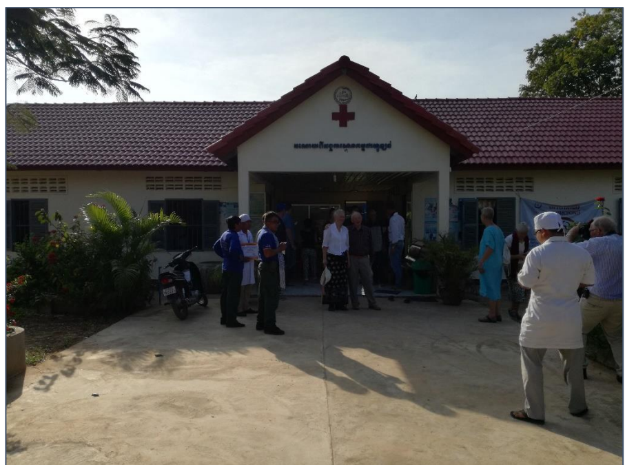
Het healthcenter in Tong Rong dat dit jaar is gerepareerd.