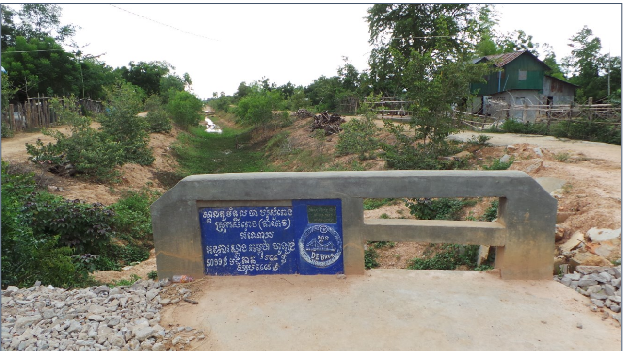
Een kleine brug, maar heel belangrijk voor het verkeer tussen de dorpen.

En dan wordt het hoog tijd om weer terug te gaan naar Phnom Penh. We zijn alweer 12 uur onderweg geweest vandaag.