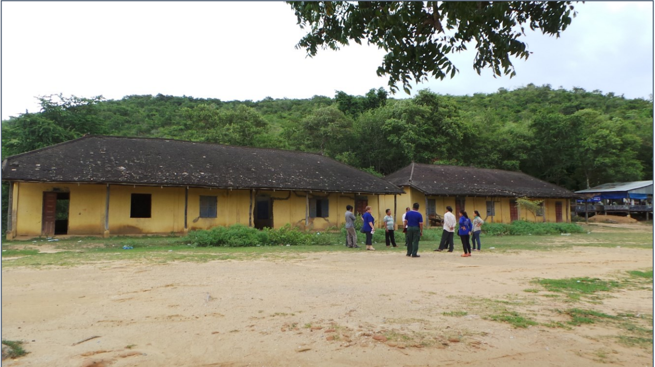
Op bezoek bij een oude school waar de bevolking ons heeft gevraagd om een nieuw gebouw met zes lokalen.

Afgelopen maandag hebben we alle verzoeken om hulp uit de dorpen op een rijtje gezet om te kijken welke de meest urgente zijn. Vandaag bezoeken we er een paar. We gaan twee oude scholen bekijken waar de lokalen overvol zijn en waar de bevolking ons heeft gevraagd om een nieuw schoolgebouw.