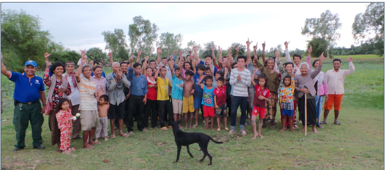
Groepsfoto voor de oude vijver die uitgegraven zal worden in 2017

Aangekomen bij de vijver zien we heel veel mensen staan. Ze vertellen dat ze al uren op ons