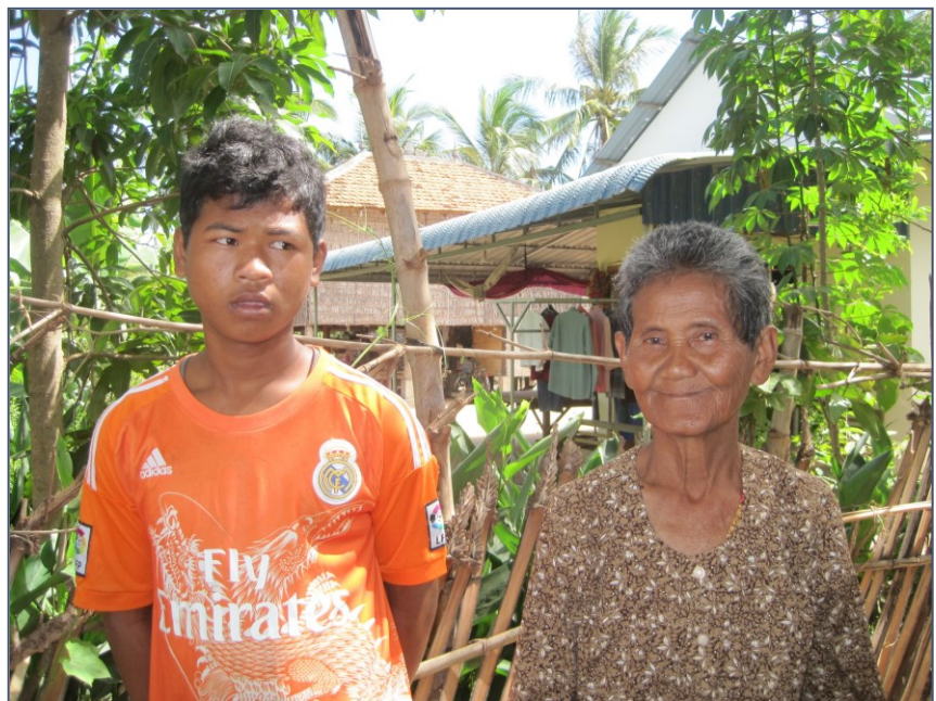
Oma Ting met één van haar kleinzonen

We bekijken twee bruggen die onlangs zijn afgebouwd van diverse afmetingen. Blijde dorpingen vertellen hoe belangrijk deze bruggen zijn voor het verkeer, transport van zieken en van goederen en voor