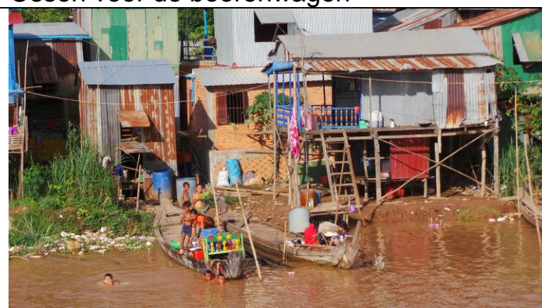
Aan de Mekong leven en spelen.