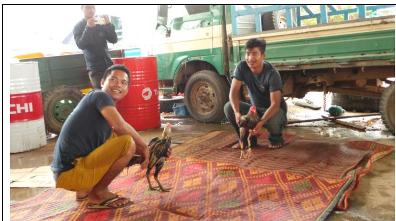
Hanengevecht voor de filmopname