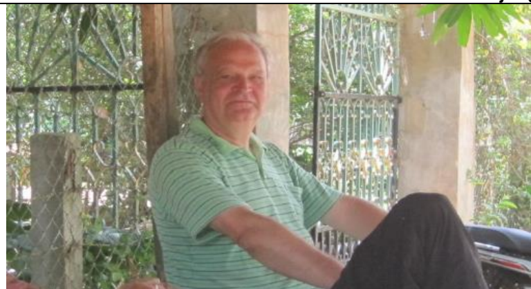
Rens wel thuis! Goede tijd samen gehad.