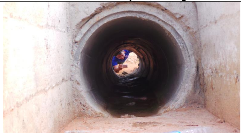
Koy en ik controleren de duiker