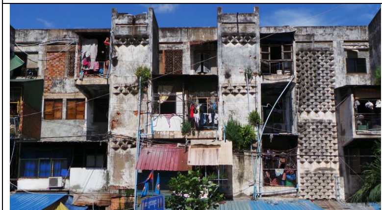
Oude nog gebruikte flats in Phnom Penh