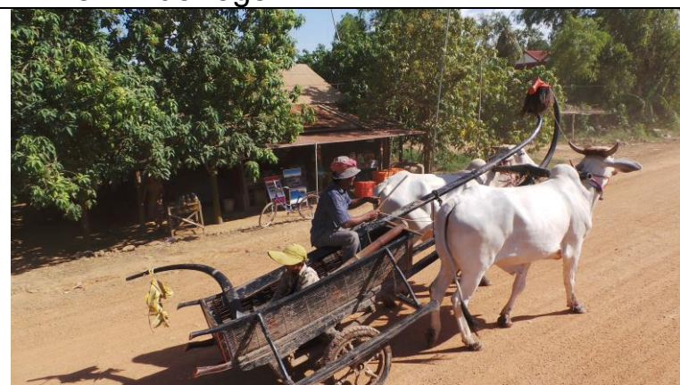
Ossen voor de boerenwagen