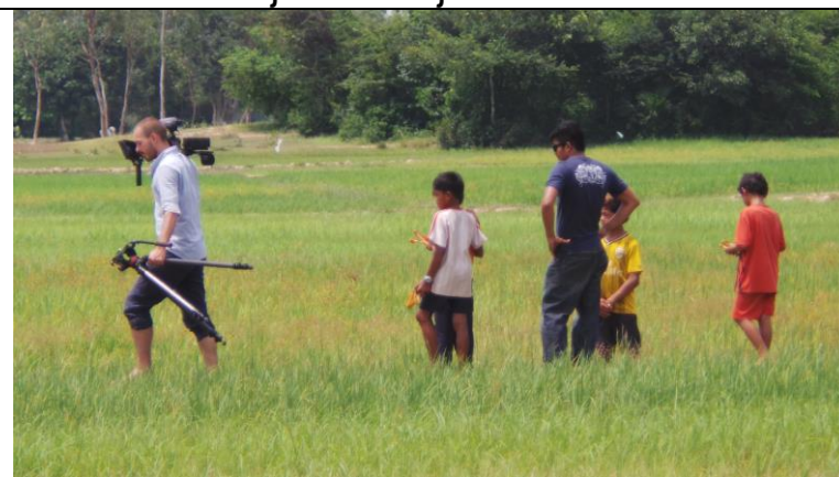
Filmen in het rijstveld