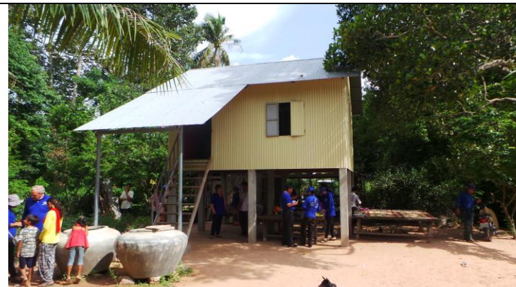
Nieuw Spie-en huis in Takeo