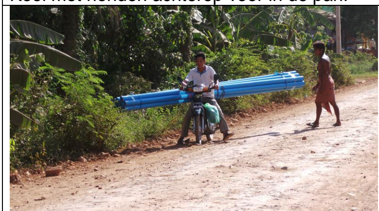
Buizen overdwers achter op de bromfiets vervoeren