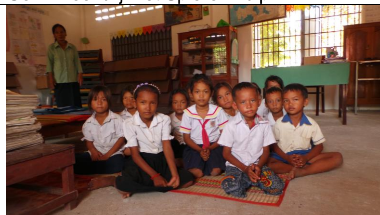
In een schooltje voor bijles.