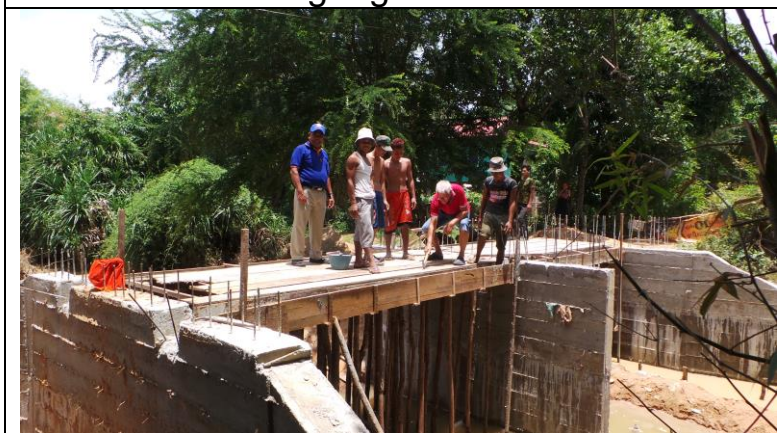
Een nieuwe brug van Spie-en in aanbouw