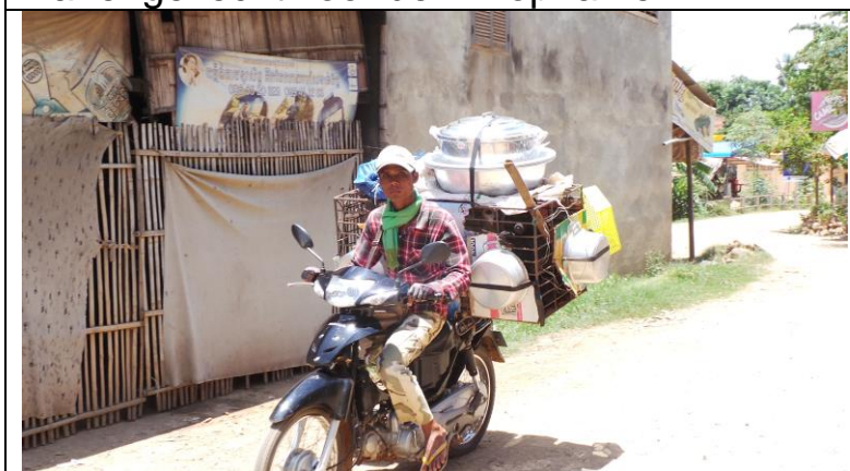
Kooi met honden achterop voor in de pan!