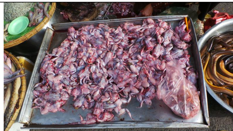
Gevelde kikkers voor bij de rijst