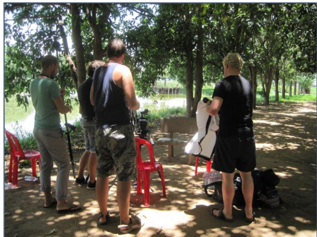
Dit is de plek waar het interview met ons werd afgenomen.

Dit jaar maakten ze in Oekraïne de film "Face Down" en in Groenland "Arctic light" die binnenkort in première gaat.