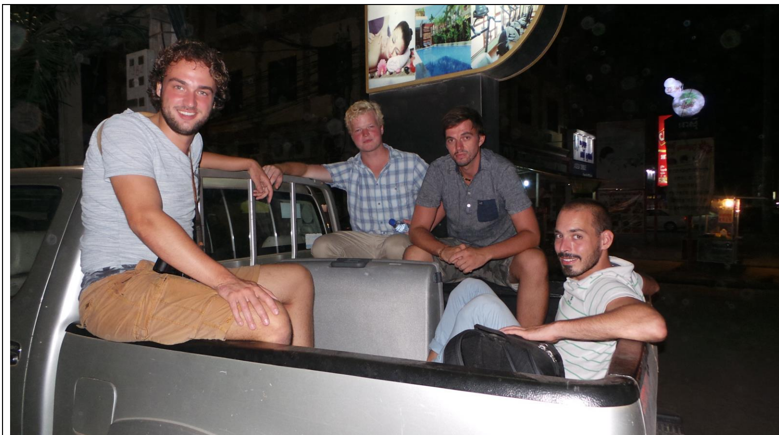
Het filmteam vertrekt. Mooie maar drukke tijd gehad.