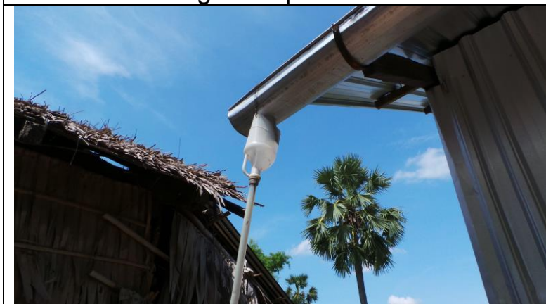
Regenwater opvangen om te drinken