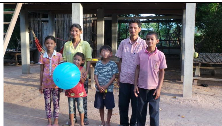
Gezin heel blij met Spie-en hulp