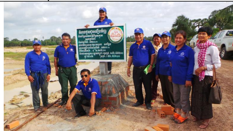
Een nieuw kanaal (ze zijn er trots op!)