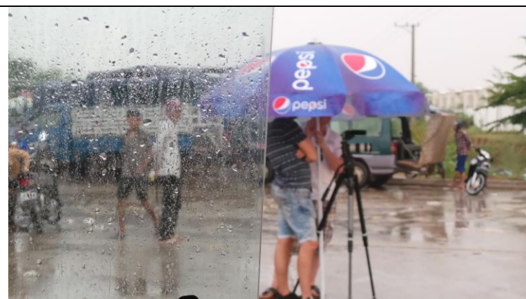
Filmen in de regen