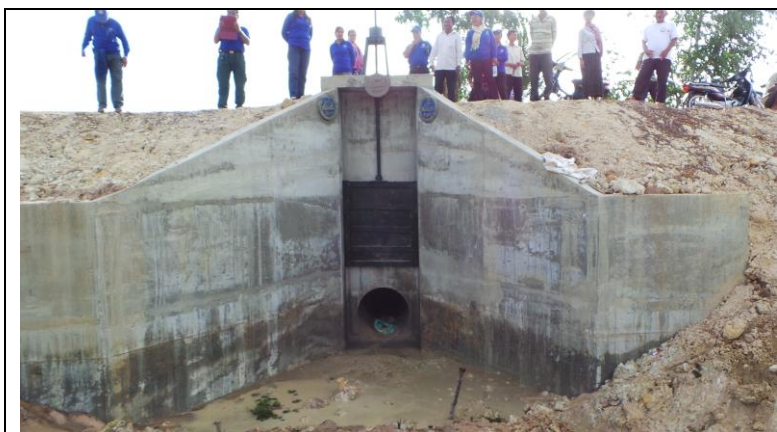
Een nieuwe sluis