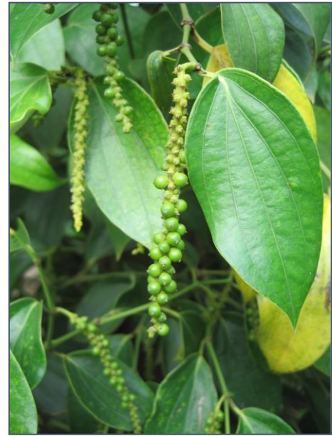
Peperkorrels, als ze zwart zijn worden ze geogst en gedroogd