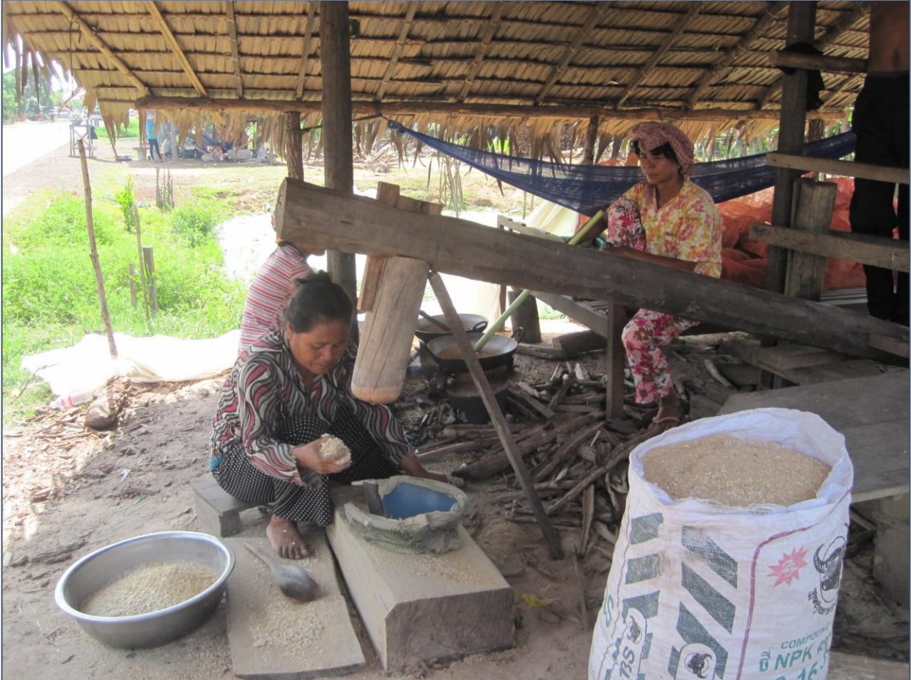
Onderweg naar Siem Reap wordt ambok gemaakt. Rijstkorrels worden gepoft en platgestampt.