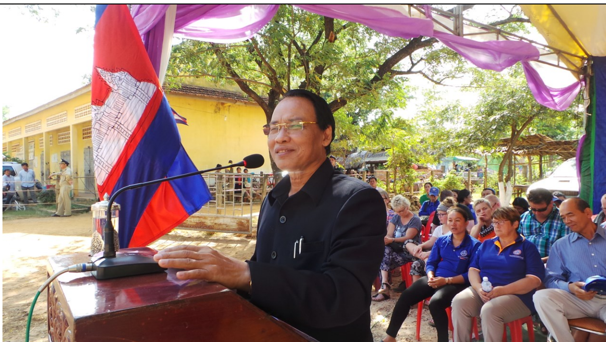
De gouverneur opent de school in Kork Trea