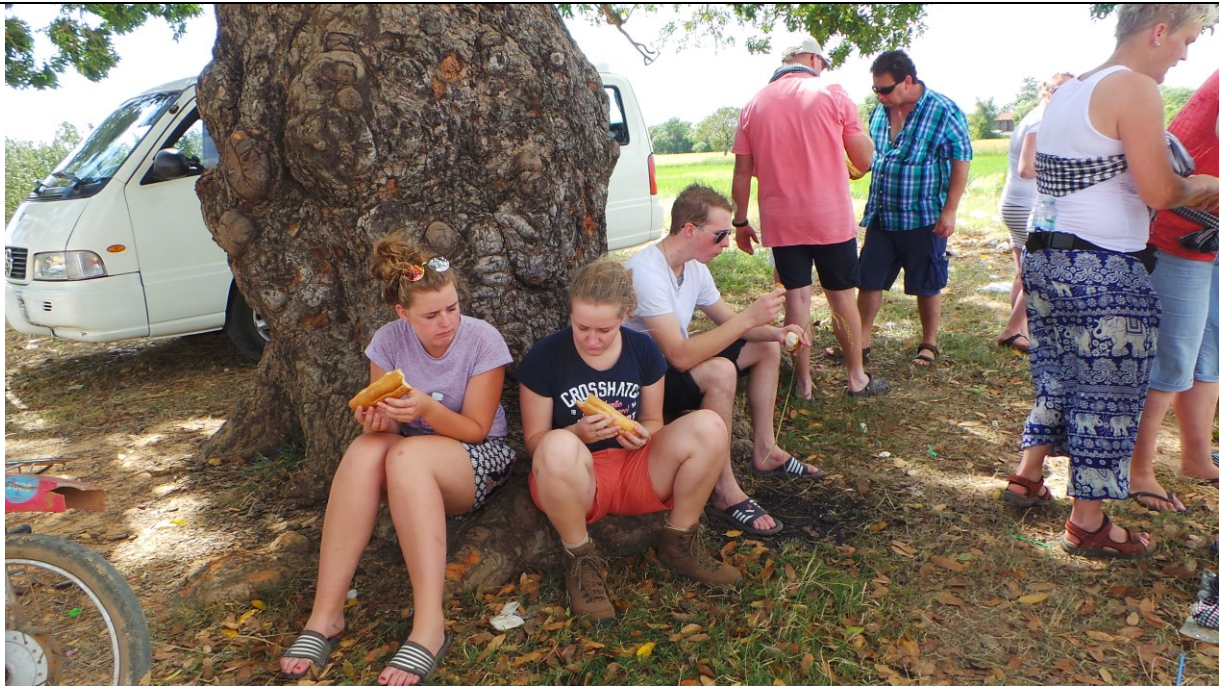
Lunchen onder de boom met gasten voor de bruiloft.